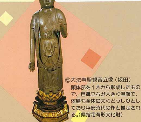
⑤大法寺聖観音立像(坂田) 頭部を1木から彫成したもので、目鼻立ちが大きく温顔で、 体軀も全体に太くどっしりとして おり平安時代の作と推定され る。(県指定有形文化財)

③内郷の大一位 「一名」あまのたけのこ」ともい う。樹令九五〇年、十一年の老樹株が ある。(県指定文化財)