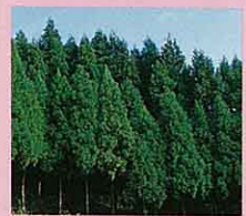
●町の木「杉」 杉の名は「直ぐなる木」か ら転じたといわれ、直幹性 で成長は早く、しかも幾百 年、時には幾千年も生きる ものがあります。古くから 「神木」として崇敬されて います。 昭和54年4月10日制定