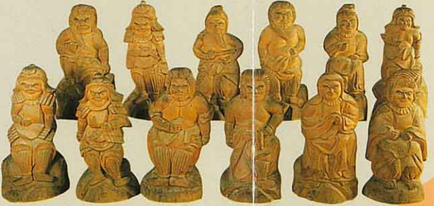
⑥西光寺木喰上人薬師十二神将(長瀬) 作者は木喰上人。彫刻の線が太く鋭 く、木彫として木喰彫りの特徴をよ く表わしている。全部で12体。

④糺石尊(石地) 一尊糺石大神ともい、御神体は、里根の ままに似た海中天然石がその御姿である。 に鎮座されたのは文政十一年(一八二八) からで、御利益は男女の縁を結び、子授けの神と 知られている。