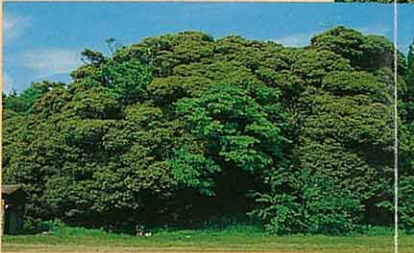
⑨御島石部神社・椎の樹叢(石地) 延喜式神名帳にある古社である。神殿の周 圍は巨匠熊谷源太郎による手持竜・鯉や鳩 が彫刻されている。 ●椎の樹叢 御島石部神社のうしろの高 地に樹群。面積約20a。椎の木原山林では日 本海沿岸における北限をなしている。(県指定天然記念物)