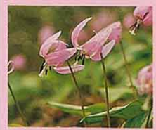
●町の花「カタクリ」 ユリ科で、その紫の花は可 憐で美しく、長い冬をたえ て、早春3月から咲き始め 春来るを告げます。古来、 詩歌に数多く詠まれてきま した。 昭和54年4月10日制定