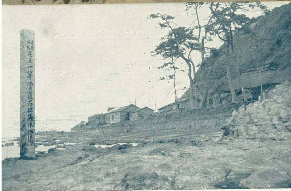
近県名所 一等当選 石地海水浴場