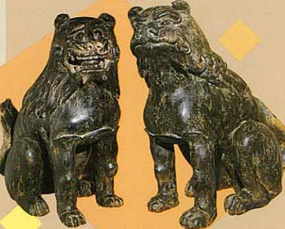
⑦二田物部神社(狛犬一対) 木彫墨塗の雄雌一対。高さ2尺、2尺 5寸、鎌倉時代の優秀な作品である。 (県指定有形文化財)