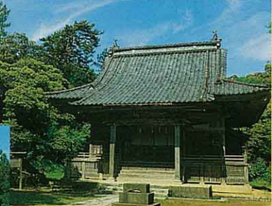
⑩明治天皇行在所・長屋門(石地) 明治11年9月14日明治天皇が北陸巡行の際、 立寄られ、ご休憩、ご昼食をされた旧内藤 家の屋敷。