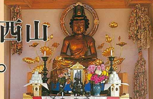
⑧懸橋寺の大日如来座像(石地) 御本尊は胎藏界大日如来で高さ4尺7 寸の木造座像であり室町時代の作と推 定されている。